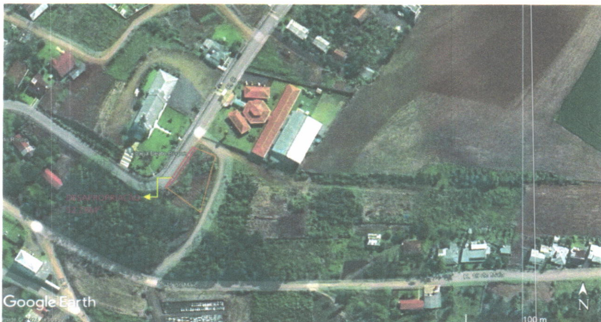
IMAGEM 01: Vista aérea da localização do imóvel, GOOGLE EARTH 2024.

Os elementos pesquisados no mercado, assim como os parâmetros de cálculos adotados para a homogeneização como fator oferta, fator topografia, fator superfície, fator aproveitamento, fator melhoramentos, fator acessibilidade, fator de porte e fator transposição, conduziram ao seguinte valor unitário: R$ 220,00 (duzentos e vinte reais) por metro quadrado.