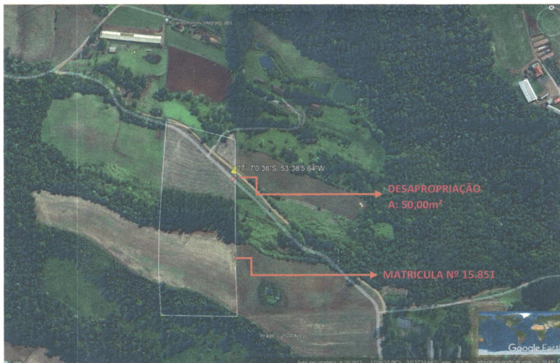
IMAGEM 01: Vista aérea da localização do imóvel.

Os elementos pesquisados no mercado, assim como os parâmetros de cálculos adotados para a homogeneização como fator oferta, fator topografia, fator superfície, fator aproveitamento, fator melhoramentos, fator acessibilidade, fator de porte e fator transposição. Portanto, considerando que é uma área rural, tendo uma fração pequena de área, e ainda incorporando custos com averbação em matrícula, e além desta, terá uma área com interferência de aproximadamente 40,00m 2 , que abrange a movimentação de terra, alteração do tamanho de acesso particular para possibilitar entrada e saída dos veículos da municipalidade. Estes dados conduziram ao seguinte valor unitário: R$ 30,00 (trinta reais) por metro quadrado.